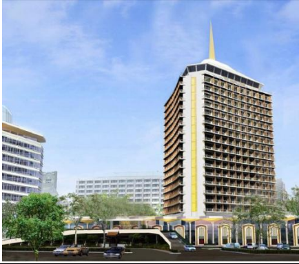
(Dusit Thani Bangkok Hotel) 亞太餐飲及學術教育議會會議會場