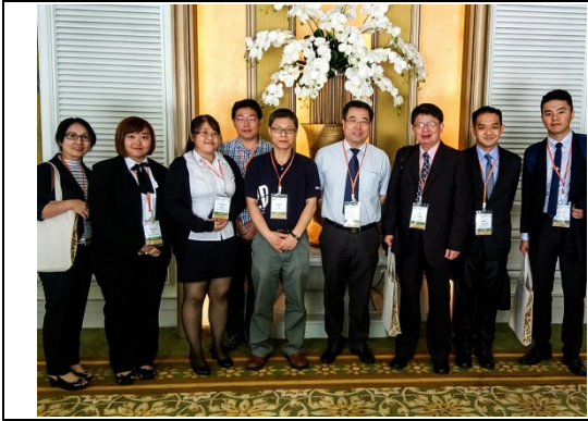
與暨大師生一同拍照紀念