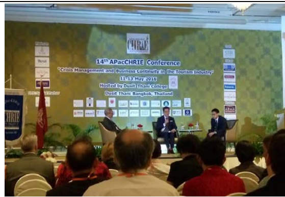
Industry Hour: In-dialogue