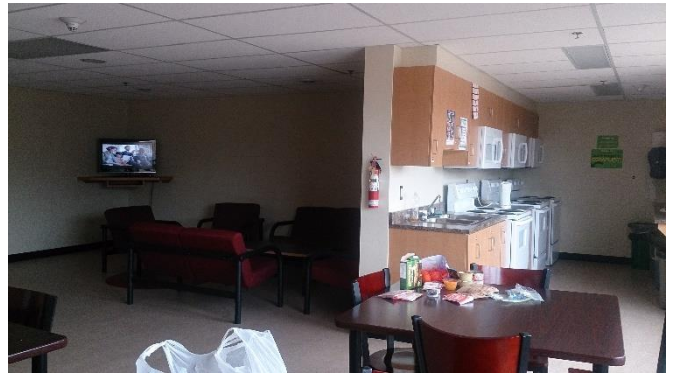
Old Residence 廚房交誼廳