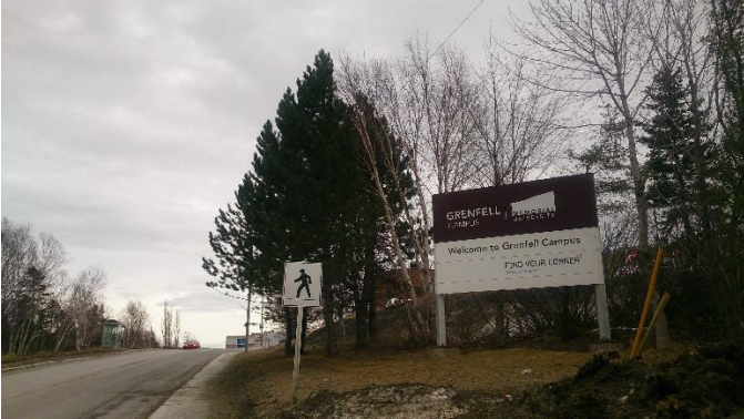
紐芬蘭紀念大學 Grenfell 校區