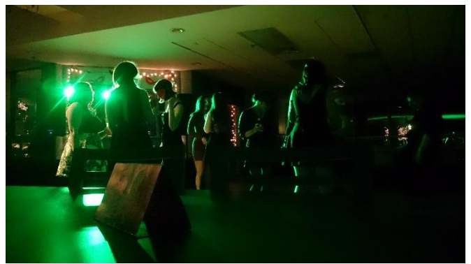
學校食堂旁的 Backlot 派對