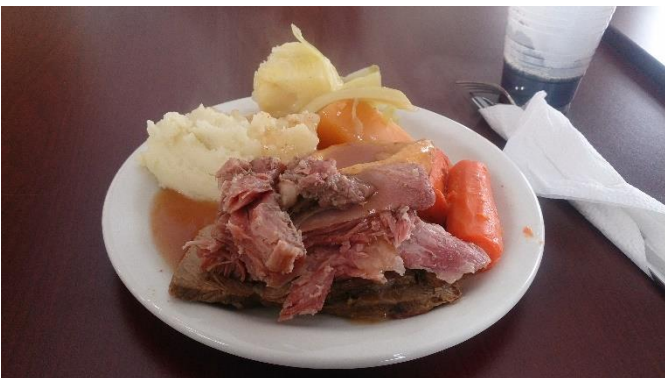
紐芬蘭傳統晚餐 Jiggs dinner